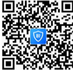
扫码下载“个人所得税”APP